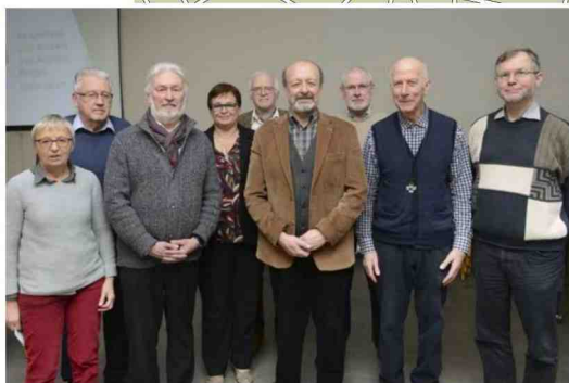
■ De Emmaüsparochie stelde maandag haar ingrijpende plannen voor.

Vlaamse Eeklo wil vermijden. "Daar kreeg de parochie de beslissing van het gemeentebestuur door de strot geramd. Dan kiezen we liever voor de vlucht vooruit, met een eigen kerkenplan. Het is ook in tijden van crisis dat je moet investeren. En door te vernieuwen, trek je ook nieuwe mensen aan. Al mogen we eigenlijk niet klagen: elk weekend ontvangen de kerken samen zowat vijf- tot zeventienhonderd kerkgangers."